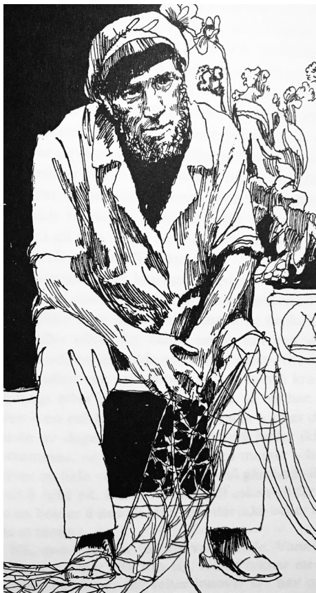
Fiskeren Markus Illustrasjon: Rolf Graff

I 2018 er det 100 år siden Gabriel Scott ga ut boken «Kilden, eller brevet om fiskeren Markus». Det er en makeløs bok, skrevet mot slutten av 1. verdenskrig. Fiskeren Markus lever et enkelt og nøysomt liv i pakt med naturen. Markus