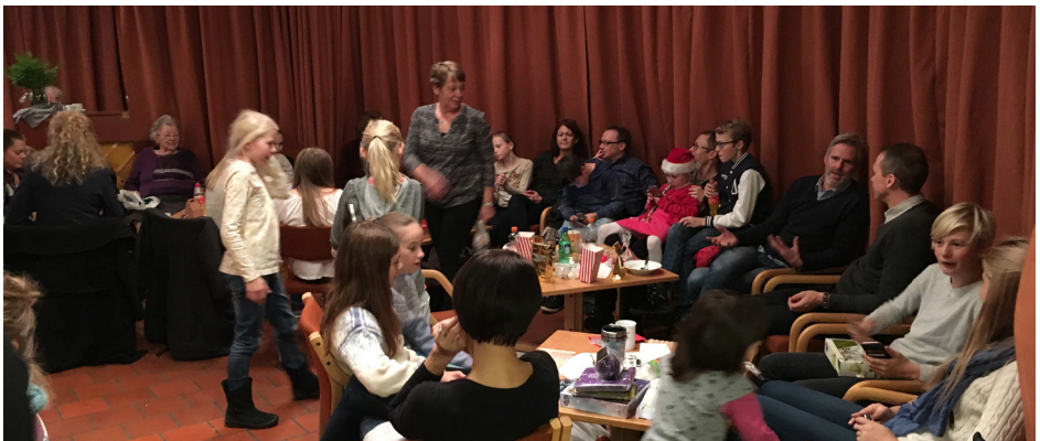
Fra Julemessa 2016.