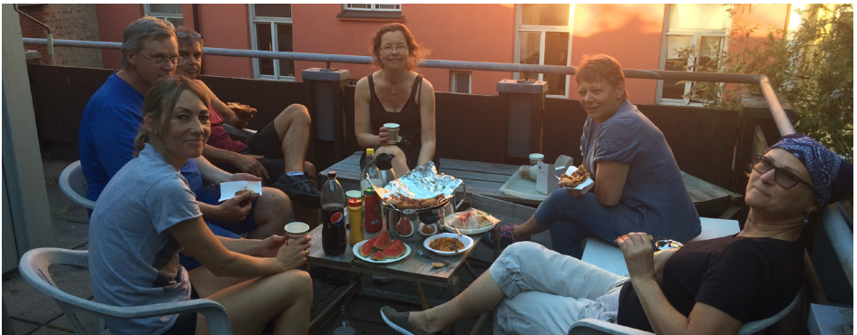
Dugnadsgjengen tar en velfortjent pust i bakken.

Hjertelig takk til alle som deltok på dugnaden!