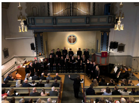
Jubileumsgudstjeneste 8. mars