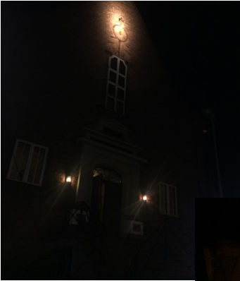
Belysning slik den er i dag.