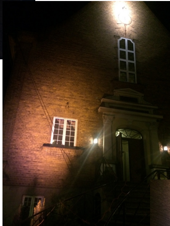
2 eksempler på hvordan det kan bli.