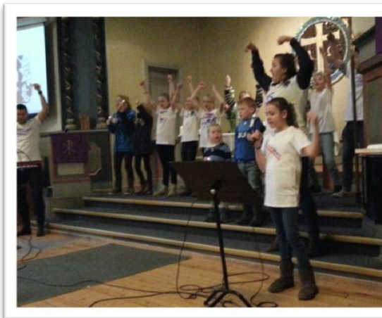
Bilder fra Lys våken november 2014