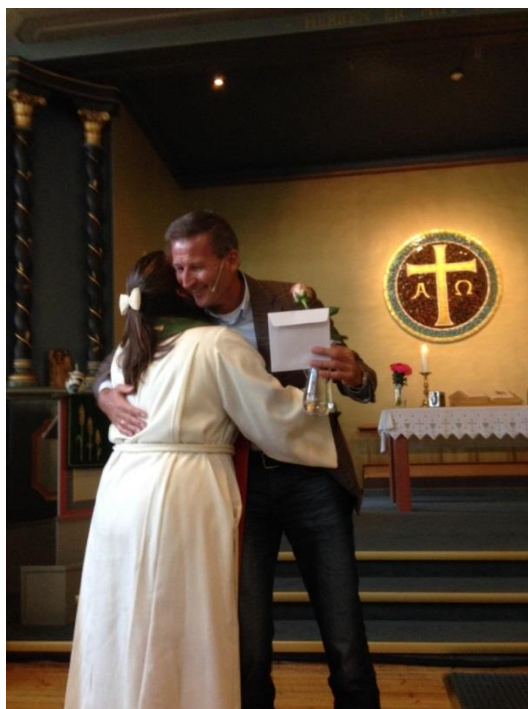
En god avskjed fra formann i eldsterådet

- Jeg skal preke i Vestre den 1. november, og kommer gjerne og preker av og til. Forrige uke var jeg på besøk i Bærum og prekte og jeg er fremdeles med i styrer og råd for Frikirken. Så selv om dere ikke ser meg så mye som før, holder jeg på i kulissene. Så kommer nok gudstjenesteabstinensene snart.