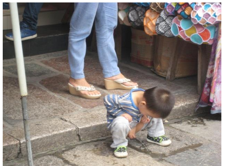
Må man, så må man!