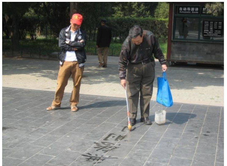
Pensjonisten holder skriveferdighetene ved like.